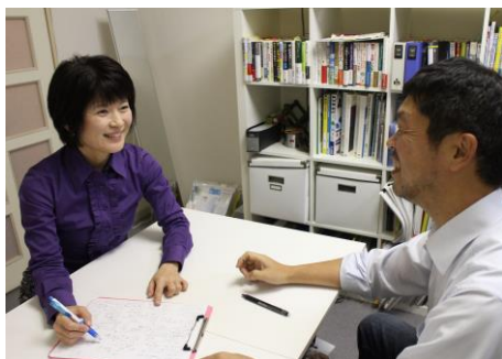
和気あいあいとした雰囲気でのヒアリング

自分の強みが見えてきて、とても嬉しかった。この強みを活かして、夢に向かって進んでいきます!